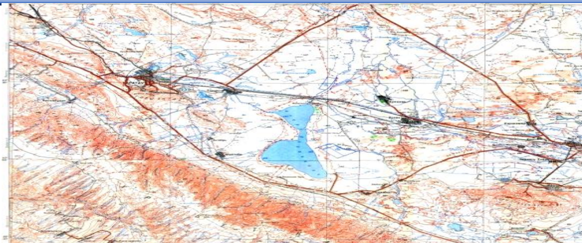
Сурет 1 - Биликөл көлінің географиялық орны

Көл бір бірімен жіңішке өзек арқылы жалғасатын екі бөліктен тұрады. Қазіргі уақытта көлдің акваториясының ауданы 57,6 \text{ км}^2 , ұзындығы - 32 км, ені - 1,8 км, ең терең нүктелері - 8 м, орташа тереңдігі - 3 м. Су деңгейінде айтарлықтай ауытқулар бар және Аса және Берікқара өзендерінен келетін су көлеміне байланысты акватория ауданы да өзгеріп тұрады. Басқа шағын су көздері көлдің гидрографиялық сипаттамаларына әсер етпейді.